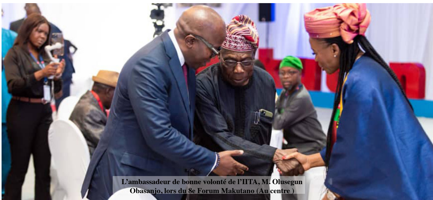
L'ambassadeur de bonne volonté de l'IITA, M. Olusegun Obasanjo, lors du 8e Forum Makutano (Au centre)

L'ambassadeur de l'IITA, l'ex-président Nigérian, Olusegun Obasanjo a été accueilli par le président de la République, Félix-Antoine Tshisekedi, parrain du forum Makutano, pour une séance d'échanges afin de discuter sur des propositions concrètes pour booster le secteur agricole de la RDC.