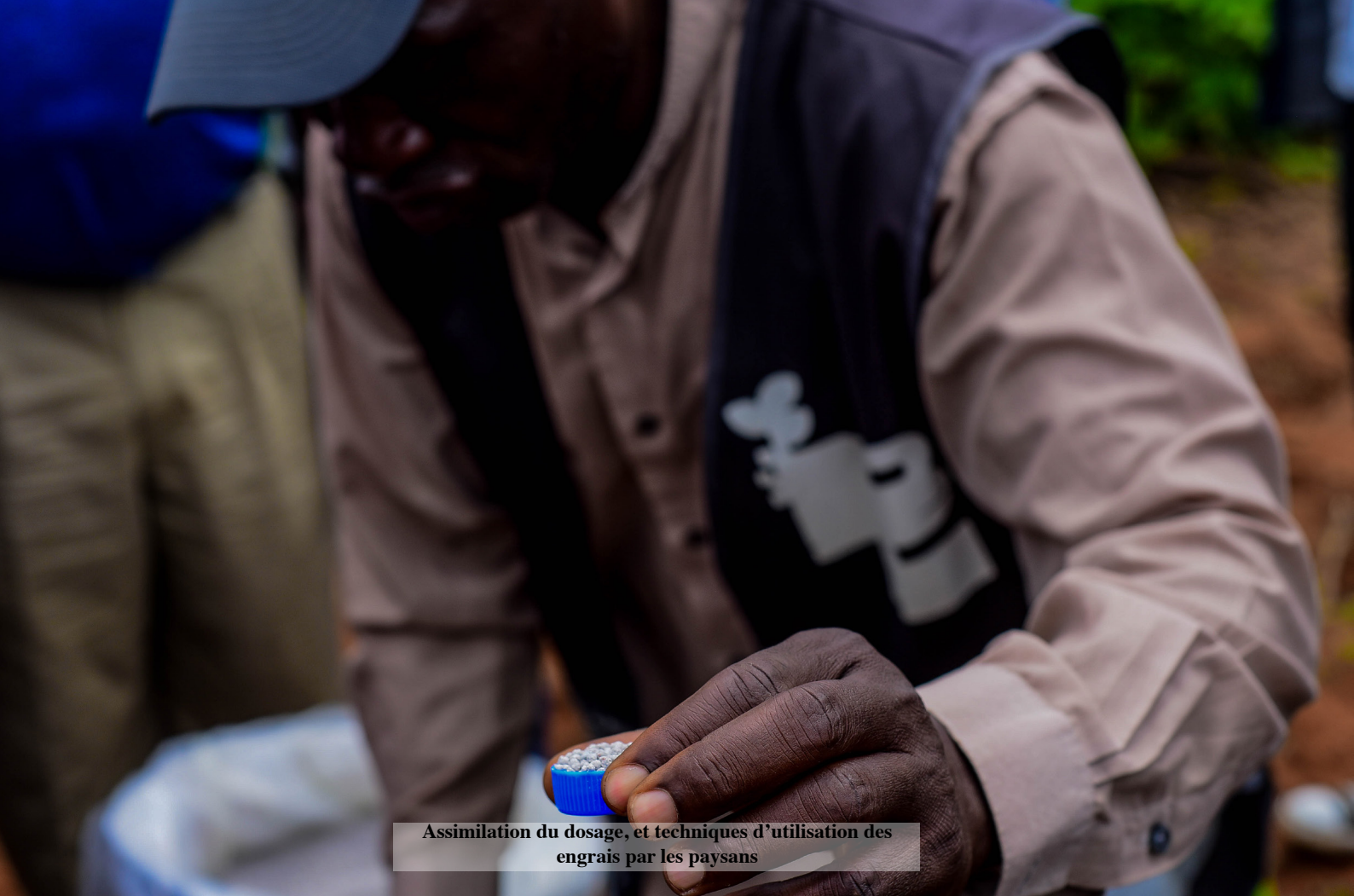
Assimilation du dosage, et techniques d'utilisation des engrais par les paysans