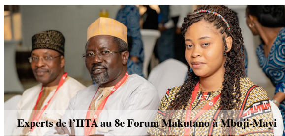
Experts de l'IITA au 8e Forum Makutano à Mbuji-Mayi

L'ambassadeur de l'IITA, l'ex-président Nigérian, Olusegun Obasanjo a été accueilli par le président de la République, Félix-Antoine Tshisekedi, parrain du forum Makutano, pour une séance d'échanges afin de discuter sur des propositions concrètes pour booster le secteur agricole de la RDC.