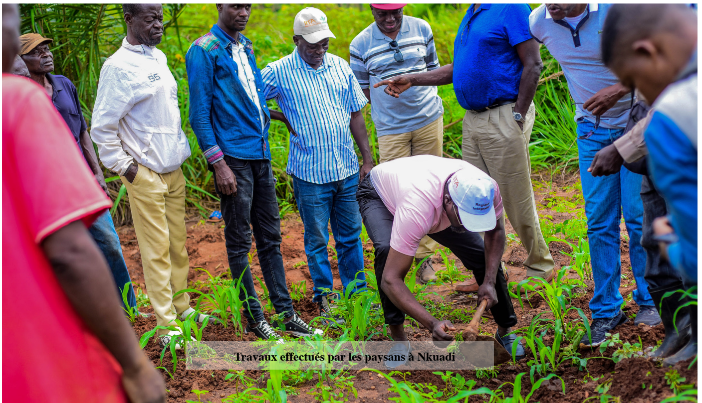
Travaux effectués par les paysans à Nkuadi

Ce qui représente une amélioration de plus de 400% par rapport aux 650 tonnes de maïs produites l'année passée. Cette production continuera à augmenter les années suivantes comme notre programme en milieu rural continue à s'épandre.