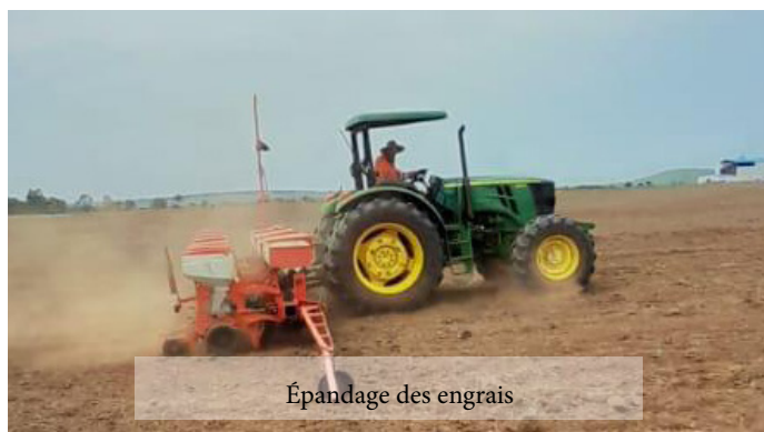
Épandage des engrais