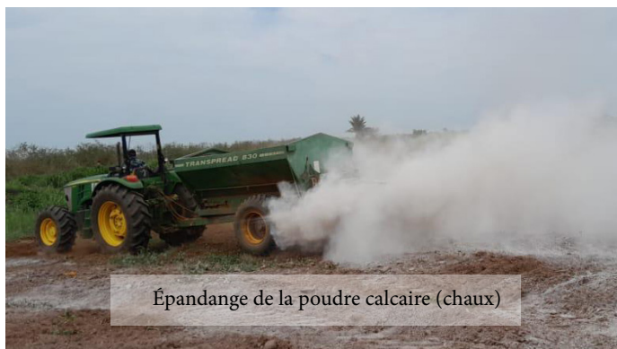
Épandage de la poudre calcaire (chaux)