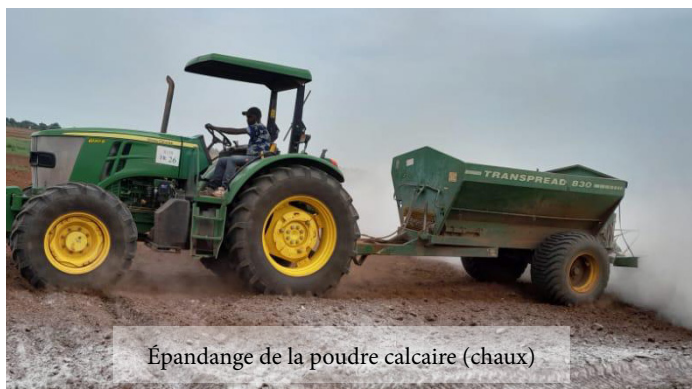
Épandage de la poudre calcaire (chaux)