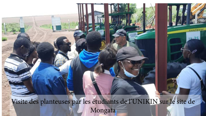
Visite des planteuses par les étudiants de l'UNIKIN sur le site de Mongata