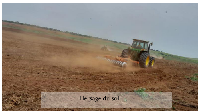
Hersage du sol

les travaux de la mise en place du champs semencier pour le site de Nkuadi (le hersage du sol , l'épandage de la poudre calcaire(chaux) pour diminuer l'acidité du sol ,le semis du maïs avec l'épandage des engrais de fond, puis la pulvérisation du sol avec les herbicides) sont en cours.