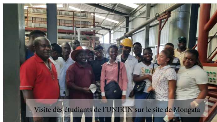
Visite des étudiants de l'UNIKIN sur le site de Mongata