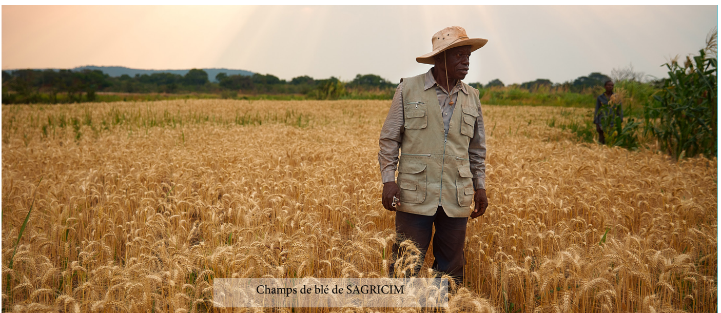
Champs de blé de SAGRICIM

Le semis s'est fait en pleine saison sèche et nécessité un apport hydrique sous forme d'irrigation à l'aide d'une motopompe et d'un système d'aspersion constitué de tuyaux et de tourniquets. Les techniques culturales de base ont été utilisées pour conduire cette culture de blé.